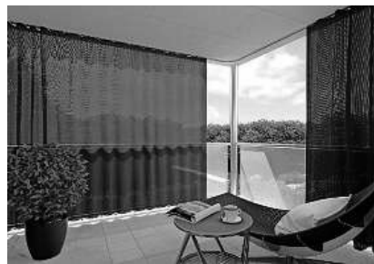
Willkommen zum Sonderverkauf.

Pünktlich zum Sommeranfang führt Robert Ruoss & Co. AG vom 21. bis 30. Juni einen Sommer-Sonderverkauf durch.